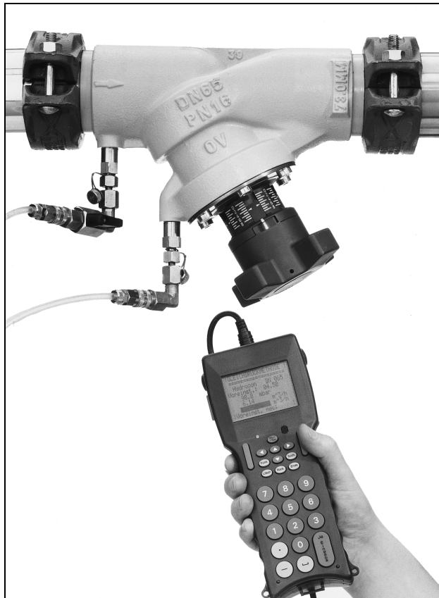
„OV-DMC 2” арт. №. 106 91 77

Гарантийные обязательства фирмы Oventrop, действующие на дату поставки.