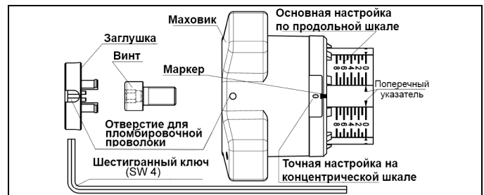
Рис. 7.1 Настройка

Для этого закрыть вентиль, чтобы обе шкалы были выставлены на 0. Затем вынуть заглушку, вывинтить винт и легким движением снять маховик со шпинделя вентиля. Не меняя настройки (выставлен '0') повернуть маховик так, чтобы окошко концентрической шкалы было хорошо видно. Затем снова надеть маховик на шпиндель вентиля и зафиксировать. Вставить заглушку.