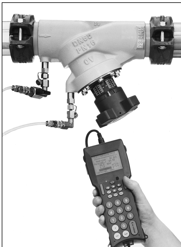
„OV-DMC 2” арт. № 106 91 77

Technische Änderungen vorbehalten. Subject to technical modification without notice. Sous réserve de modifications techniques. Technische wijzigingen vorbehalten. Salvo modifichie tecniche. Reservado el dercho a efectuar modificaciones. Rätten till tekniska ändringar utan föregående varning förbehålles. Zastrzegamy sobie prawo wprowadzania zmian technicznych bez uprzedzenia. Technické zmeny vyhradeny. Technické zmeny vyhradnené. Műszaki változtatás joga fenntartva. Технические изменения оговариваются. 欧文托普保留对产品变更的权利，恕不事先通知。